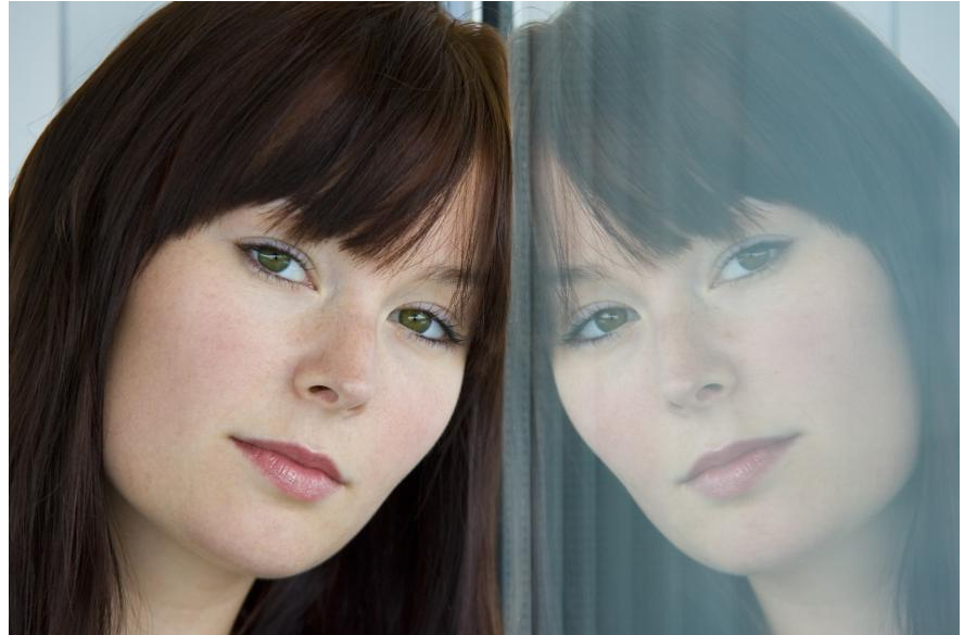
Wer unzufrieden mit dem Aussehen seiner Zähne ist, traut sich oft nicht, sie zu zeigen. Wie können Zähne schöner gemacht werden? Wie funktioniert Bleaching? Was sind Veneers? Hier bekommen Sie die Antworten.