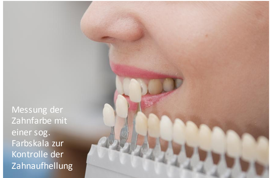
Messung der Zahnfarbe mit einer sog. Farbskala zur Kontrolle der Zahnaufhellung

Wer seine Zähne aufhellen lassen will, steht vor der Wahl: Selber machen mit Mitteln aus dem Internet oder aus dem Drogeriemarkt? Oder doch lieber vom Zahnarzt, weil man sich da besser aufgehoben fühlt?