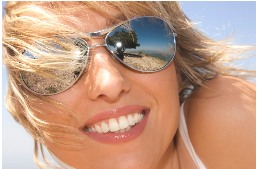
Wenn man schöne weiße Zähne hat, kann man unbefangen reden und lachen. Es macht Spaß, solche Zähne zu zeigen!

Außerdem sollten die Zähne vor der Aufhellung professionell gereinigt werden: Wenn noch Beläge auf den Zähnen sind, kann das Aufhellungsmittel nicht richtig wirken. Aus all dem sehen Sie: