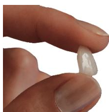
Veneer: Hauchdünne Schale aus Keramik

In allen diesen Fällen können mit Veneers ästhetische und ansprechende neue Zähne gestaltet werden. Wenn Sie Wert auf natürlich schön aussehende Zähne legen, die lange halten, sich nicht verfärben und die Ihre Zähne und Ihr Zahnfleisch schonen, sind Veneers die richtige Lösung für Sie!