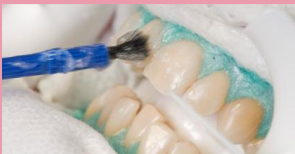
Power-Bleaching in der Zahnarztpraxis: Nachdem das Zahnfleisch zum Schutz abgedeckt wurde, wird hochkonzentriertes Bleaching-Gel auf die Zähne aufgetragen. Nach ein bis eineinhalb Stunden sind die Zähne deutlich heller. Obwohl beim Power-Bleaching hochkonzentriertes Bleaching-Gel verwendet wird, ist es sicher, weil es unter Aufsicht des Zahnarztes erfolgt.