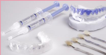
Home-Bleaching-Set: Bleaching-Gel (links oben) und Trägerfolie (links unten), die mit dem Bleaching-Gel über die Zähne gestülpt wird. Rechts oben das Gipsmodell, auf dem die Trägerfolie hergestellt wurde.

Beim Home-Bleaching hellen Sie Ihre Zähne zu Hause auf. Die dafür notwendigen Hilfsmittel erhalten Sie vom Zahnarzt. Er kontrolliert vorab, ob Ihre Zähne für das Bleichen geeignet sind und lässt