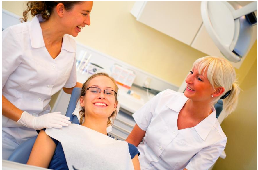
Regelmäßige Professionelle Zahnreinigungen in der Praxis haben viele Vorteile: Ihre Zähne sehen danach besser aus. Sie schützen sich vor Karies, Parodontose und Mundgeruch. Und Sie haben wieder einen frischen Atem.

Beläge sind nicht nur ein kosmetisches Problem: Sie können auch Karies (Löcher in den Zähnen) und Parodontose (Zahnlockerung) verursachen. Außerdem