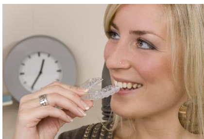
Invisalign: Kieferorthopädische Regulierung mit durchsichtigen Kunststoff-Folien

ante ist die sogenannte Invisalign -Technik. Das sind durchsichtige Kunststoff-Folien, die Sie selbst bei Bedarf in den Mund einsetzen. Sie sind so gestaltet, dass sie die Zähne nach und nach sanft regulieren.