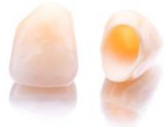
Ästhetische Kronen aus reiner Keramik

Wenn Sie noch andere Metalle im Mund haben (z.B. Amalgam, herausnehmbaren