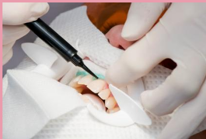
Power-Bleaching in der Zahnarztpraxis: Auftragen des Schutzgels auf das Zahnfleisch.

So bezeichnet man im Englischen das Aufhellen der Zähne in der Zahnarztpraxis. Es wird vor allem dann gemacht, wenn der Patient wenig Zeit hat oder schnelle Ergebnisse möchte.