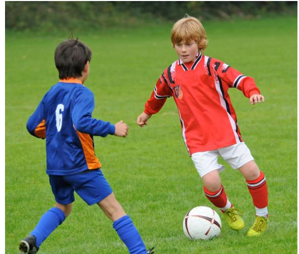
Gerade beim Sport kommt es oft vor, dass Zähne durch Stöße abbrechen. Wie können solche abgebrochenen Zähne wieder repariert werden? Welche Folgeschäden können auftreten?

Wenn Zähne zu kurz sind, ist es oft am besten, sie mit Veneers dauerhaft zu verlängern.